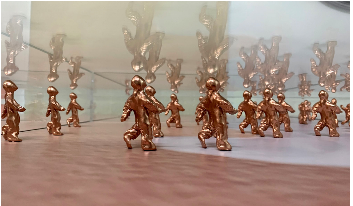
Francesca Martí (detail of installation) From the Ashes (2020), photographs, small Believers sculptures in 8 perspex boxes / fotografías, esculturas pequeñas de Believers en 8 cajas de metacrilato, 150 x 300 x 10 cm