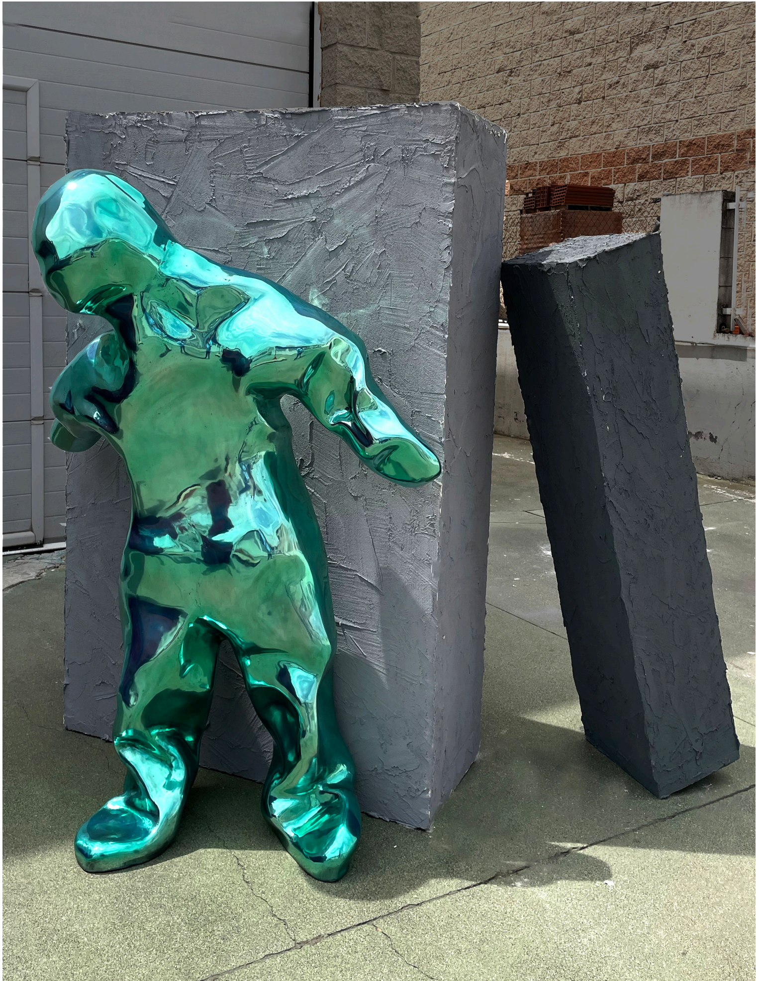
Francesca Martí Humilis as Atlantes (2023), polished aluminium, automotive lacquer, wood covered in micro-cement / aluminio pulido, pintura de automóvil, madera recubierta con micro-cemento, 170 x 100 x 70 cm